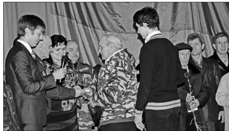
Руководство района вручает медали ветеранам.