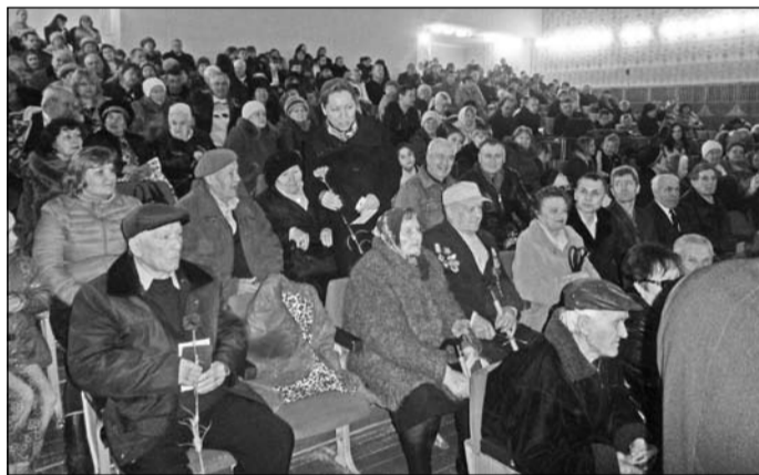
Ветераны Симферопольского района в зале Родниковского ДК.