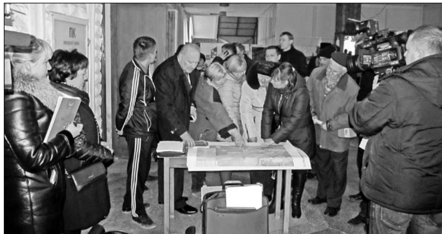
2 марта состоялись публичные слушания по строительству и эксплуатации ТЭС