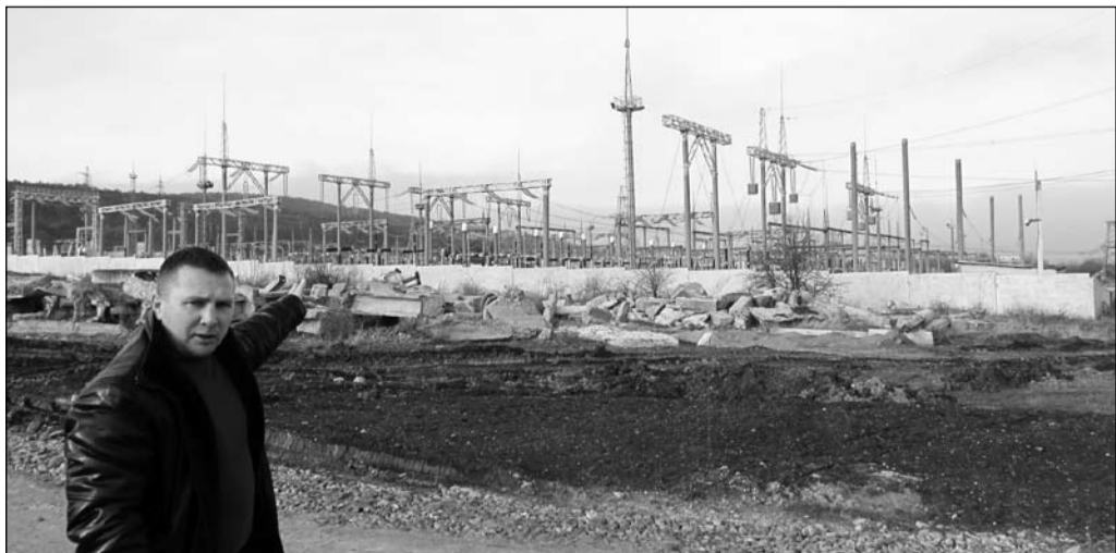
В проекте учтена уже действующая распределительная подстанция